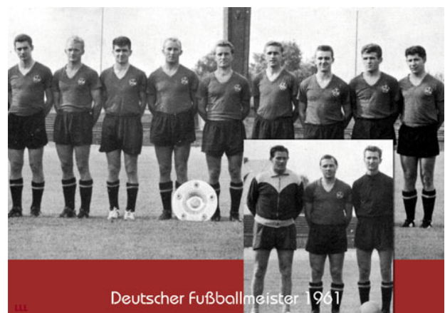
Deutscher Fußballmeister 1961