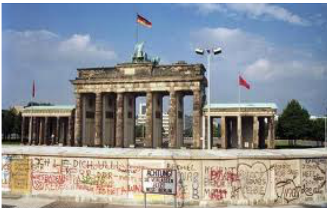
Die Berliner Mauer wird errichtet