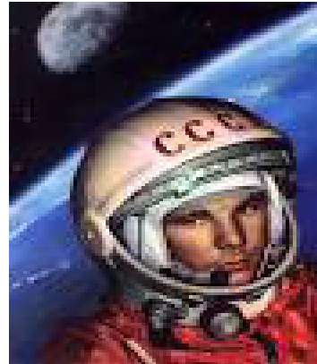
Kosmonaut Juri Gagarin startet als erster Mensch in das Weltall