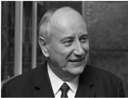
< Georg Diederichs löst Hinrich Wilhelm Kopf > als Ministerpräsident von Niedersachsen ab