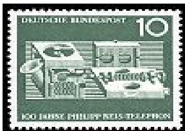
Seit 100 Jahren Telefon