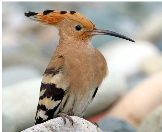
Vogel des Jahres: Wiedehopf