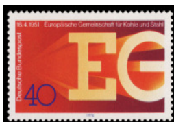
Die Europäische Gemeinschaft besteht 25 Jahre