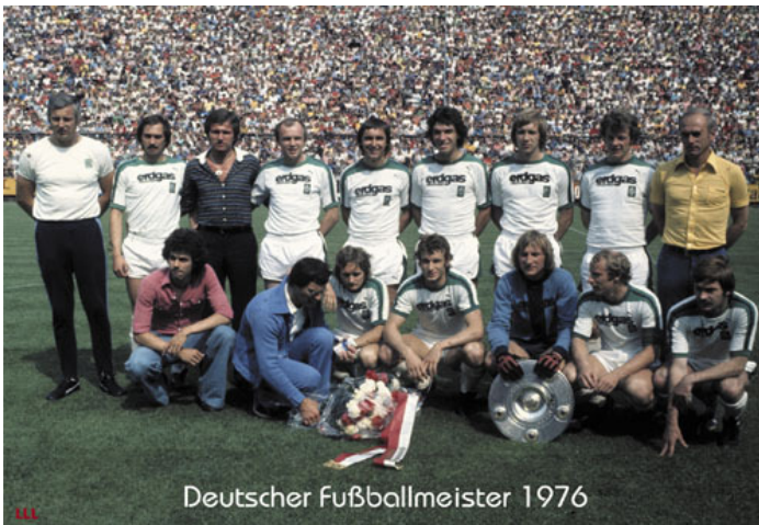
Deutscher Fußballmeister 1976

Was sonst 1976 noch geschah in Brake und der Welt: > Der Montag wird als der erste Tag der Woche festgelegt