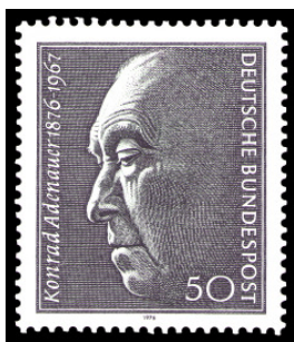
Konrad Adenauer wäre 100 geworden