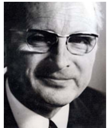
Ernst Albrecht löst den aus gesundheitlichen Gründen vorzeitig zurückgetretenen Alfred Kubel als Ministerpräsident Niedersachsens ab.