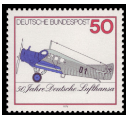
Die Deutsche Lufthansa besteht 50 Jahre